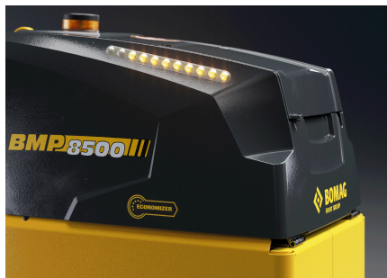
Mehr Qualität, weniger Kosten ECONOMIZER - Die Verdichtungsanzeige (optional)