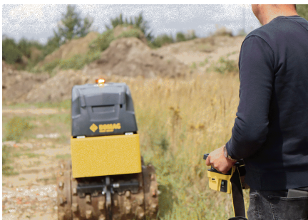
Funk-/Kabelfernsteuerung Im Servicefall Koppeln in sekundenschnelle