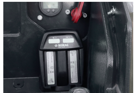
Integriertes Ladegerät (optional) Zweiten Akku laden im Funkbetrieb